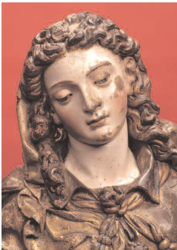
A NATURALIDADE DO ROSTRO, REFÓRZASE COA ENCARNACIÓN MATE