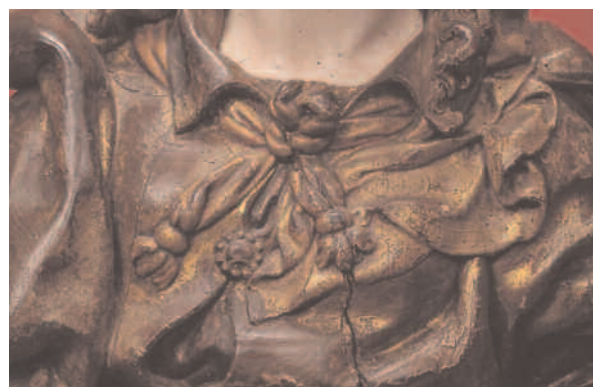
DETALLE DAS ROUPAXES E DA XOIA.

Pero a irrupción da arte de Juni producírase xa con anterioridade á presenza das ditas obras debido á chegada de artistas do seu círculo, que dende mediados de século irradian ás formas junianas na nosa rexión. Ó denominado Mestre de Sobrado, formado no obradoiro leonés de Juni e vinculado a súa primeira etapa, caracterizada pola énfase expresiva e o vitalismo dramático, débese a inicial implantación da súa peculiar linguaxe en Galicia, onde permanece