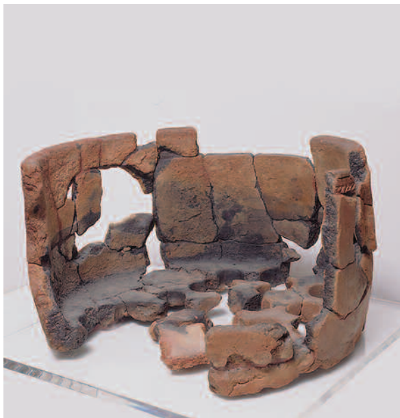
PARTE INFERIOR. VISTA INTERNA

midades de Annecy (Haute Savoie, Francia), publicado por extenso en 1975, e seguido dunha práctica arqueoexperimental do meirande interese apenas dous anos despois.