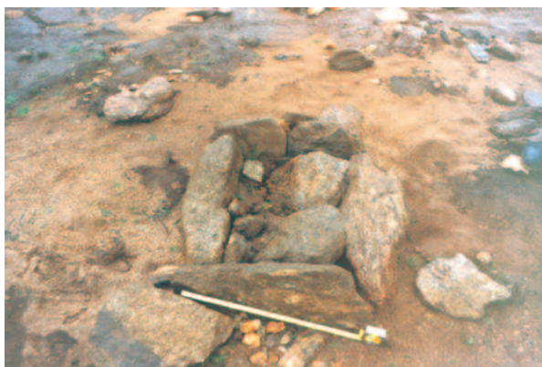
A CISTA ANTES DA SÚA APERTURA.

Nesa rasa con suave pendente destaca unha cresta transversal, menos desmontada e máis rocosa, onde se situaba a cista descuberta, aparecendo outras afloracións con agrupacións de pedras de grao e esquistos que poderan pertencer a outras cistas, sobre todo catro, situadas cara o nordeste da identificada e levantada e