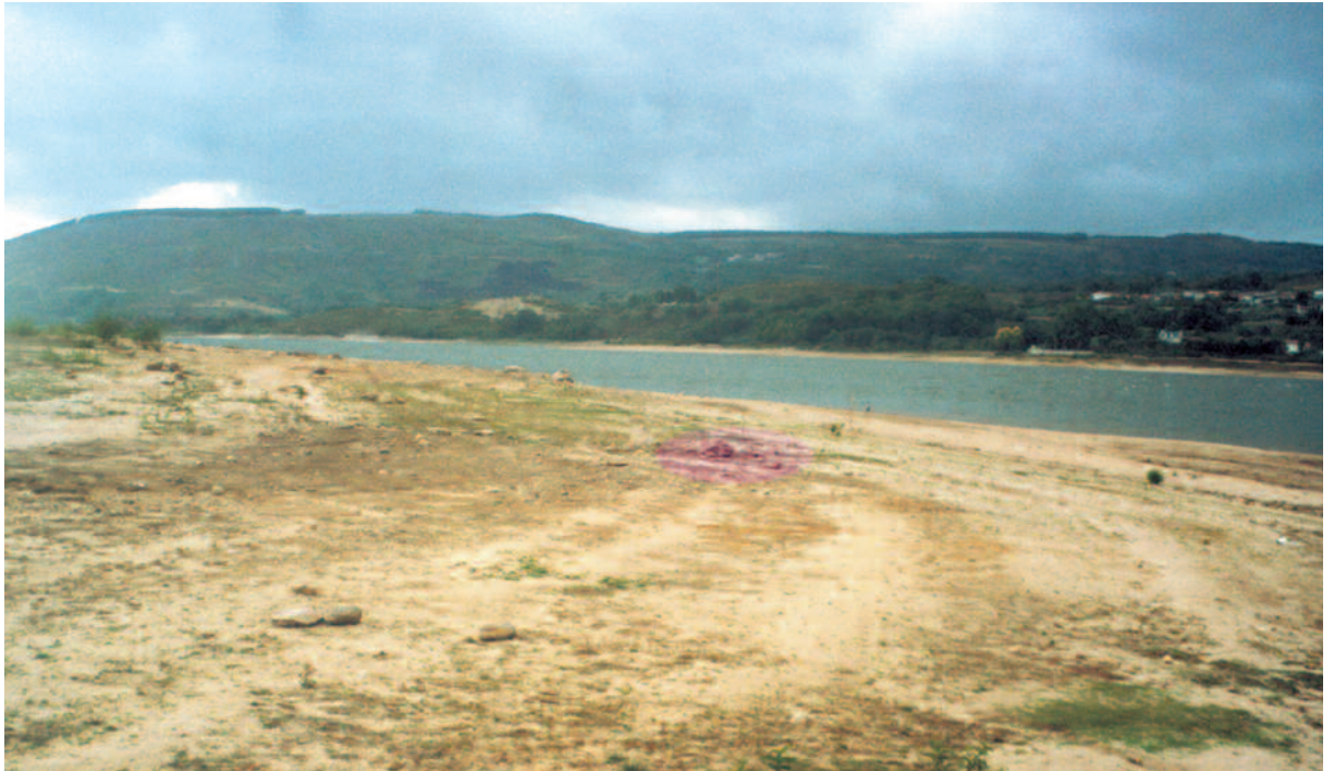
PRAIA DA ROLA. MUGUEIMES. SITUACIÓN DA CISTA NO SEU ENTORNO.