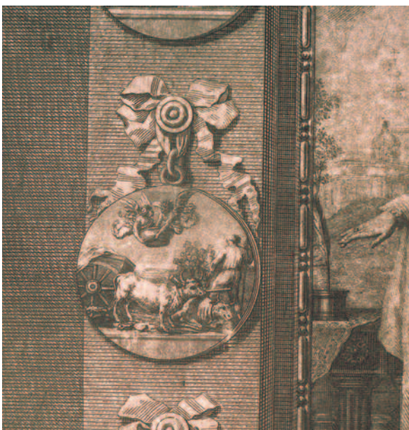
SUCESO MILAGROSO DO TRANSPORTE DA PÍA BAPTISMAL.

relegada a satisfacer a demanda de estampas destinadas a libros de contido relixioso ou outras de reducido tamaño dirixidas a despertar a devoción entre as clases populares, sendo a súa calidade xeralmente mediocre.