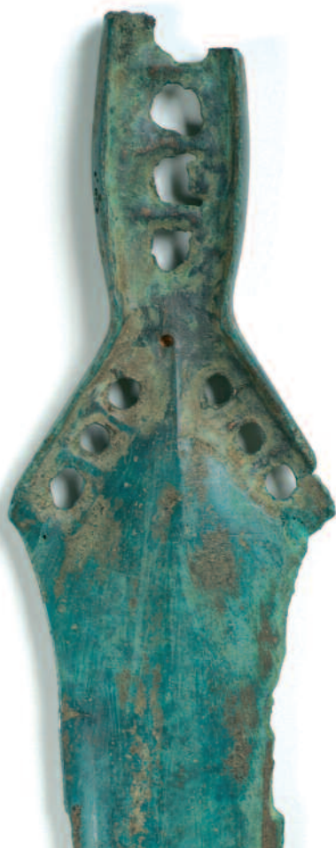
ESPADA DE MOURUÁS