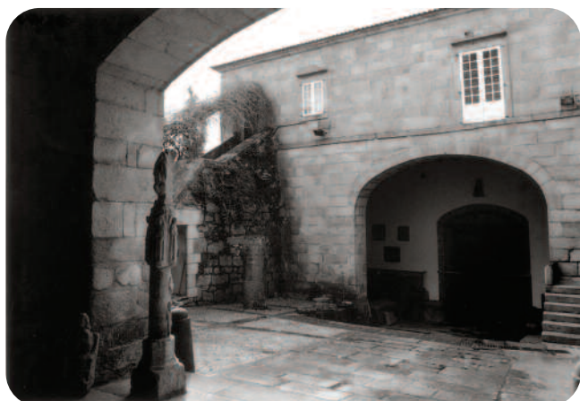
PATIO DIANTEIRO TRALA REFORMA DE 1960