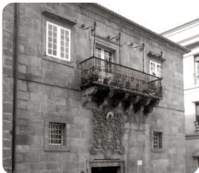
FACHADA DO EDIFICIO Á PRAZA MAIOR