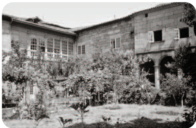
O XARDÍN E O EDIFICIO ANTES DA REFORMA DE 1960