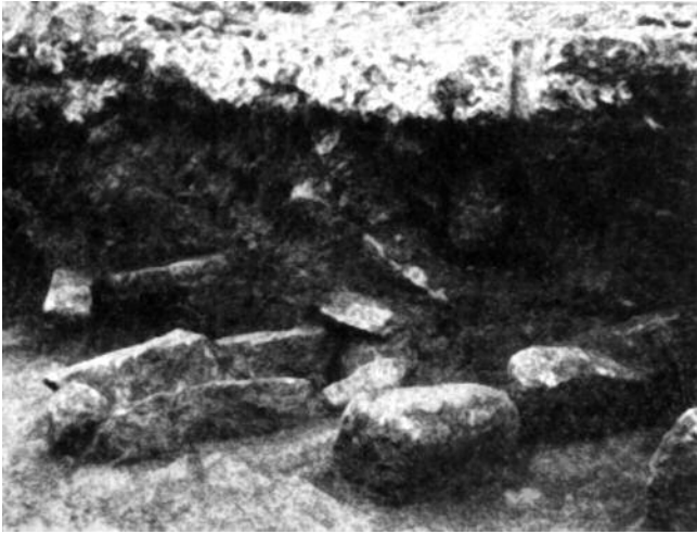
SEPULTURAS DE LAXES

para Compostela “o resto das laudes epigráficas, cando non están dislocadas da súa posición e función orixinaria, aparecen vinculadas a tumbas escavadas na rocha base do subsolo inmediato ás basílicas prerrománicas”, circunstancia que, aínda que non constada totalmente, tamén se pode anotar no caso alaricano.