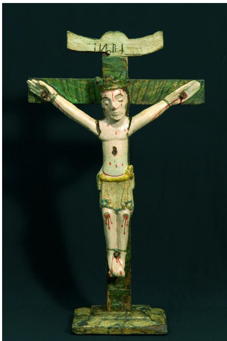
CRISTO GÓTICO DE ALLARIZ