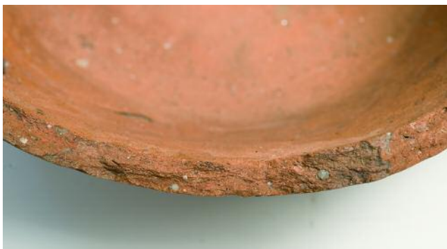
DETALLE DA PASTA

horizonte segundo: “A cerámica pintada, aínda que presente, o seu índice de aparición é baixo, tratándose temas e motivos xeométricos a base de pigmento abrancazado”, ao que noutro traballo engade a consideración “tratándose quizá, como hasta ahora se viene pensando para el norte peninsular, que corresponde a un producto de importación” .