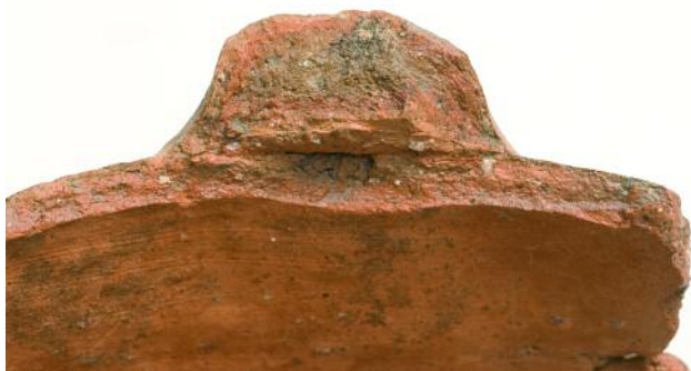
DETALLE DA PASTA E ARRANQUE DA ASA