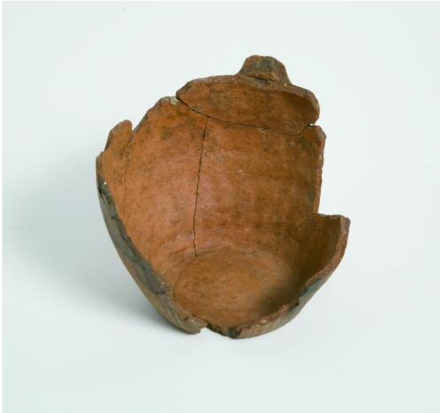
VISTA INTERIOR DA PEZA