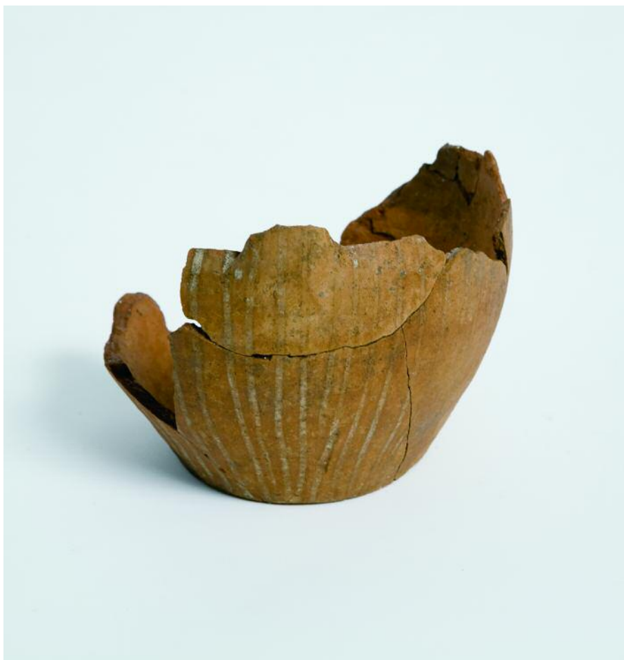
XERRA DE CERÁMICA PINTADA MEDIEVAL