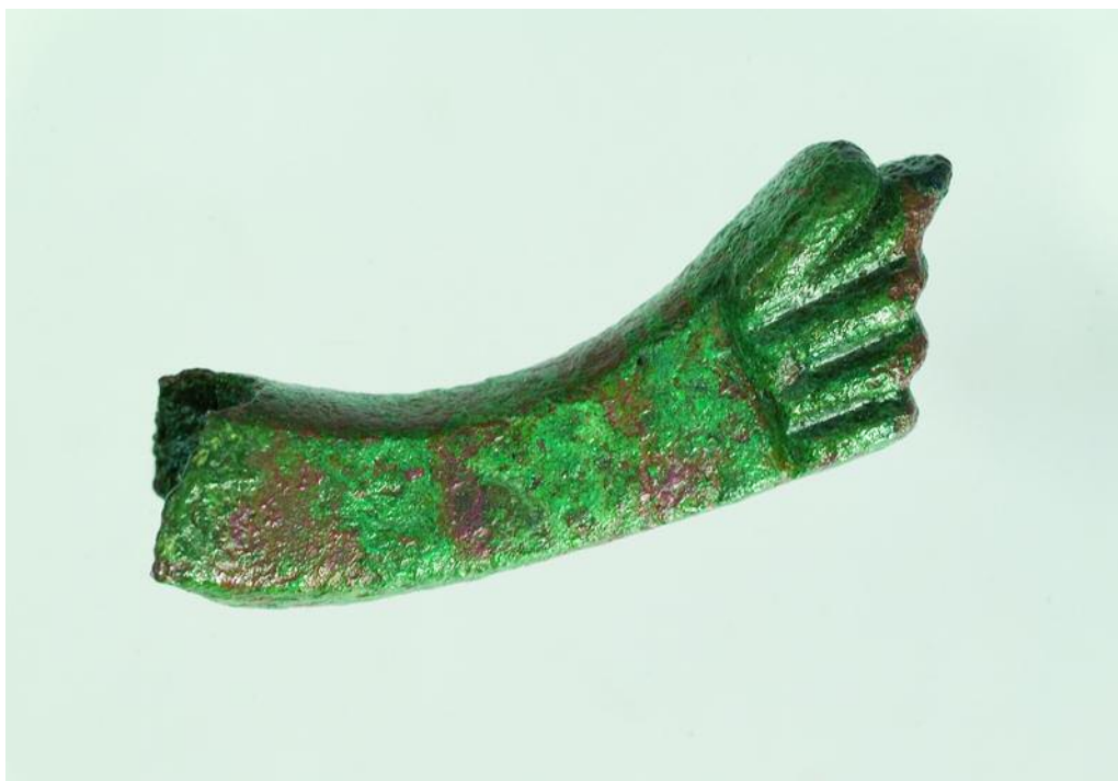
FIGA ROMANA DE SANTOMÉ