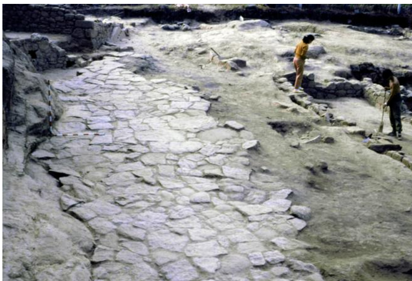
RÚA ENLOUSADA DO CONXUNTO ARQUEOLÓXICO -NATURAL DE SANTOMÉ

parte inferior co castro, nun contexto da segunda metade do século I d. C., asociada a cerámica de paredes finas, Terra Sigillata Sudgálica e diferentes tipos de lucernas.