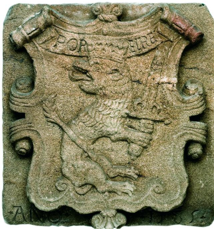
ESCUDO DE OURENSE