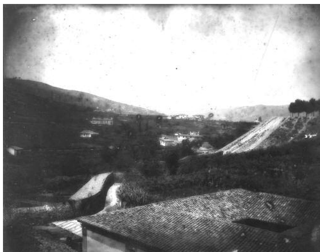
O TELLADO DO MATADOIRO E A BARRONCA EN 1899