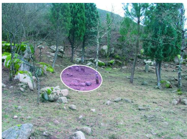
LOCALIZACIÓN DA SONDAXE