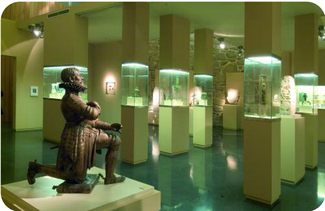
ESCOLMA DE ESCULTURA, SALA SAN FRANCISCO