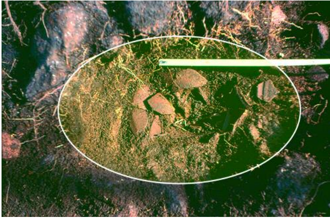
DETALLE DOS FRAGMENTOS NA SONDAXE

dobre funcionalidade tanto de tapadeira como prato dada a boa estabilidade facilitada por ditos pomos.