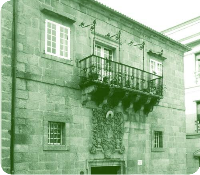
FACHADA DO EDIFICIO Á PRAZA MAIOR