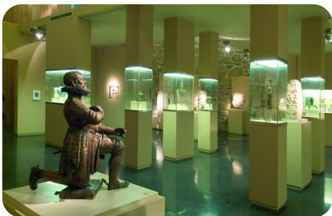
ESCOLMA DE ESCULTURA, SALA SAN FRANCISCO