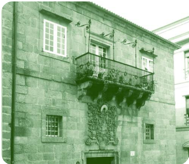
FACHADA DO EDIFICIO Á PRAZA MAIOR