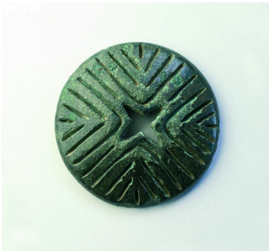
BOTÓN DA URDIÑEIRA