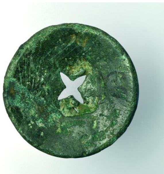
REVERSO DO BOTÓN

¿Podería ter que ver co símbolo solar? ¿Representa esta peza a adopción de emblemas e significados das sociedades do Bronce de Europa por parte das elites locais da prehistoria do noroeste peninsular? ¿Viñan os bens de prestixio acompañados dunha nova linguaxe baseada en sistemas de valores foráneos vinculados ao poder e ás cosmoloxías relixiosas? Xa é moito preguntar. O que sabemos é que se trata dun obxecto único, singular, polo que catalogar o botón da Urdeñeira como "peza do mes" é case unha afronta á súa esencia. ¡Máis ben debería estar entre as "pezas do milenio"! Pero xa se sabe como somos os arqueólogos no noso afán de seccionar e