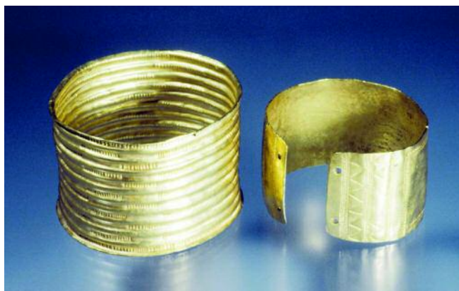
BRAZALETES DA URDIÑEIRA

A presenza de obxectos deste carisma aos pés dunha serra interior do noroeste peninsular, só pode ter que ver, dende o noso punto de vista, co xurdimento de elites neste eido xeográfico, moi relacionadas co control do tránsito entre o litoral e a meseta, tanto de materiais, de gando ou de bens. Esta interpretación é coherente co feito de que a Urdeñeira se atope nas proximidades do cruce de importantes rutas que conducen de oeste a este, cara á meseta, e rutas que conducen no eixo norte sur, en relación coa dirección dos vales fluviais. Tamén é coherente co feito de aparecer neste camiños unha cultura material característica como son as estatuas menhir como a pouco coñecida do Tameirón (A Gudiña), a de Faiões ou a de Chaves, adscribíbles tamén ao Bronce Final. Pero é que o conxunto da Urdeñeira non so fala de relacións a curtas distancias, senón de amplas relacións.