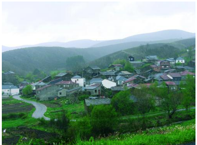
VISTA DE PARADA DA SERRA

botón como os brazaletes poden considerarse dentro da categoría social dos bens de prestixio, obxectos de alto status. Poderían ser ítems persoais no caso de tratarse dun hipotético enxoval funerario, ou mesmo dun acubillo ritual nun punto ben sinalado da paisaxe. Pero tamén, no momento da súa deposición, poderían ser simples mercadorías. En todo caso, estes son obxectos suntuarios, propios da cultura material das elites en toda Europa por volta do primeiro milenio. Iso o sabemos pola tecnoloxía de elaboración dos brazaletes, fundidos mediante a técnica da cera perdida combinada co uso do torno rotativo (as acanaladuras estaban xa feitas nos modelos en cera) e decorados por cicelado. A investigadora alemana B. Armbruster que os estudou persoalmente nos anos noventa, púxoos en relación, xunto cos brazaletes de Melide, cun tipo de ourivería que aparece na fachada atlántica europea no Bronce Final, chamada tipo Villena/Estremoz. Non son os únicos brazaletes da rexión inseribles neste ámbito. Tamén están os de Toén ou Ourense, o do Alto da Pedisqueira en Chaves, ou o do Monte da Saia en Braga. Outros, como os de Arnozela, estarían feitos a partir de lingotes anulares mediante martelado e pode-