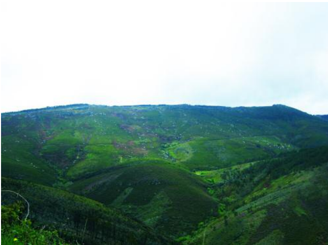
VISTA DA SERRA DA URDIÑEIRA. AO FONDO AS FRAGAS, COA COVA DAS CHOIAS. NO CENTRO, O TRABAZÓN. E ABAIXO A ZONA DA RIBEIRA

Nos anos vinte, unha pegureira de Parada da Serra (A Gudiña, Ourense), foi coas vacas ate un pradiño coñecido como A Ribeira. Era case unha nena e tiña pouco tempo para xogar. Remexendo na area cun pao, alí xunto a un grande freixo, onde o reguiño do Trabazón botaba as augas ao río de Parada, foi topar cun tesouro: dous brazaletes de ouro e un botón metálico. Levou aquelas cousas á súa irmá maior para que lle preguntara ao párroco de Parada que facer con elas. Este ben o sabía. Levounas a Ourense e vendeunas a un dignitario por cento cincuenta duros, unha fortuna da época.