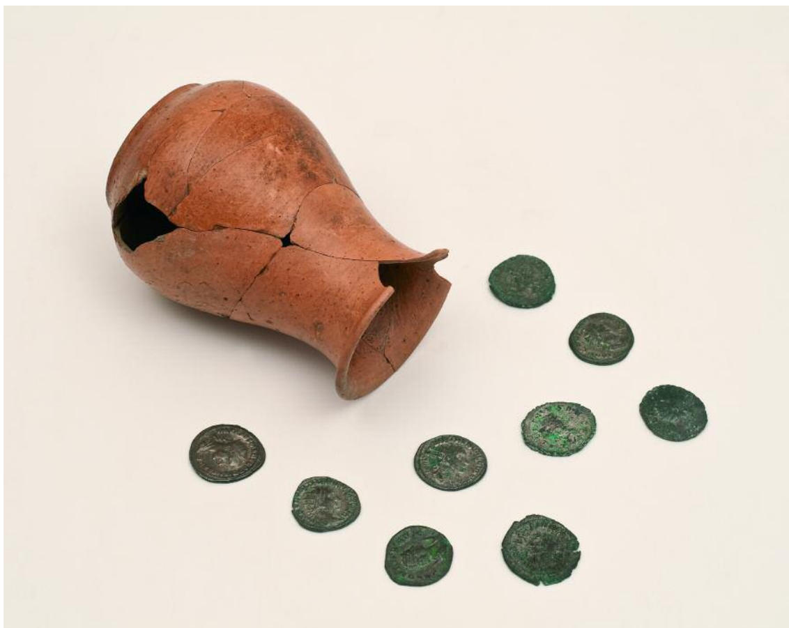
ACUBILLO DE MOEDAS ROMANAS DE PRATA. ANTONINIANOS