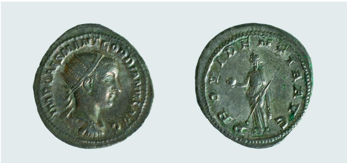
ANTONINIANO DE GORDIANO III