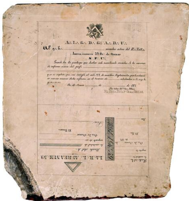
LITOGRAFÍA PARA IMPRESIÓN DE DÚAS CÉDULAS MASÓNICAS