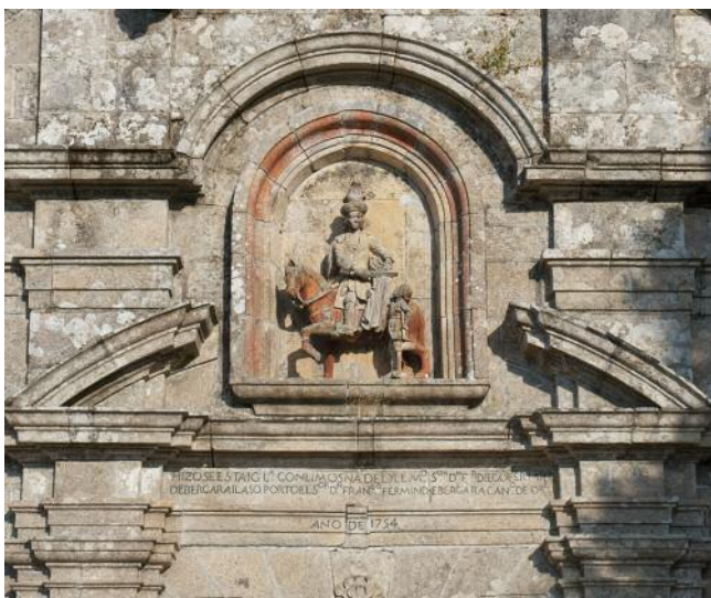
DETALLE DA FACHADA DA IGREXA DE VALONGO COA IMAXE DE SAN MARTIÑO E INSCRICIÓN CONMEMORATIVA