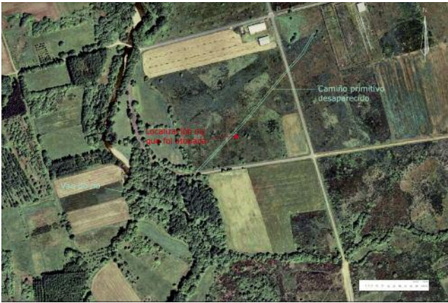
LOCALIZACIÓN DO LUGAR DE APARICIÓN