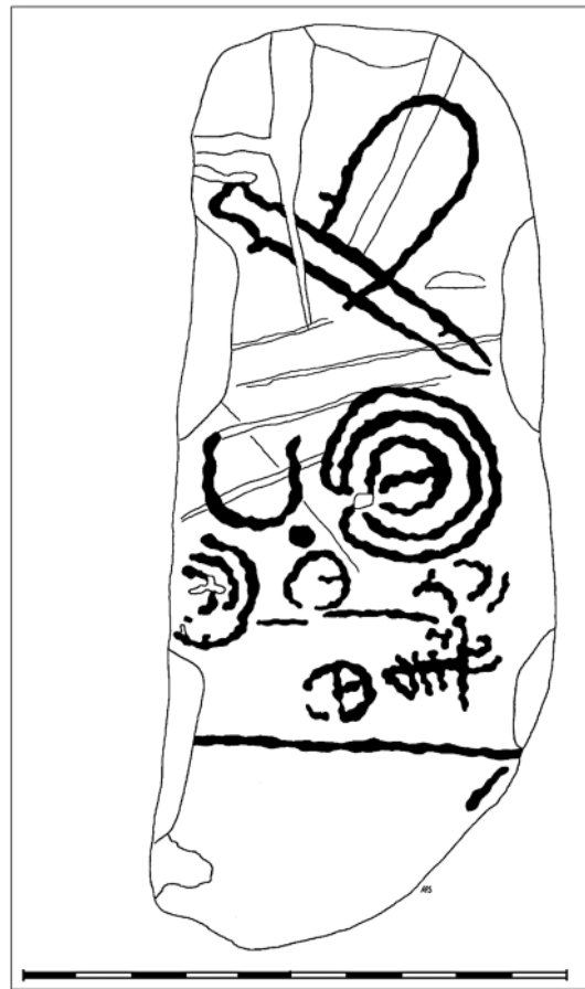
CALCO DA PEZA.

Pertence ao que a historiografía deu en chamar Estelas do Suroeste , por localizárense maioritariamente neste sector da Península Ibérica, ben que se teñen documentado algúns exemplares illados en Castela, norte de Portugal, Aragón ou no sueste de Francia. Na actualidade, en Europa, están catalogadas unicamente 116 pezas desta tipoloxía.