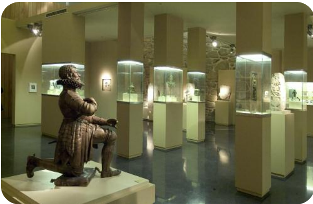
ESCOLMA DE ESCULTURA, SALA SAN FRANCISCO