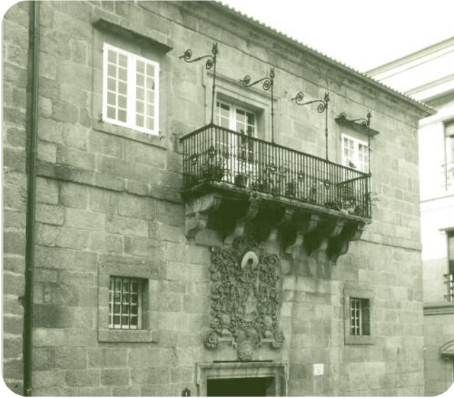
FACHADA DO EDIFICIO Á PRAZA MAIOR