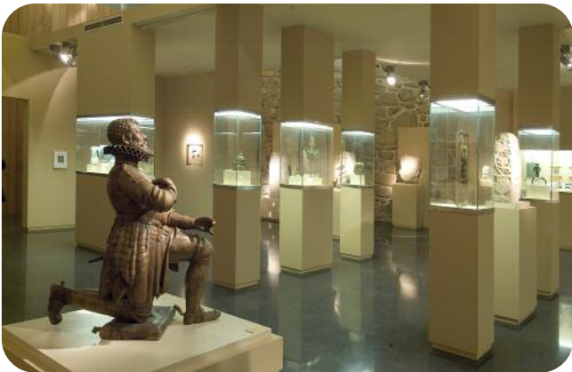
ESCOLMA DE ESCULTURA, SALA SAN FRANCISCO