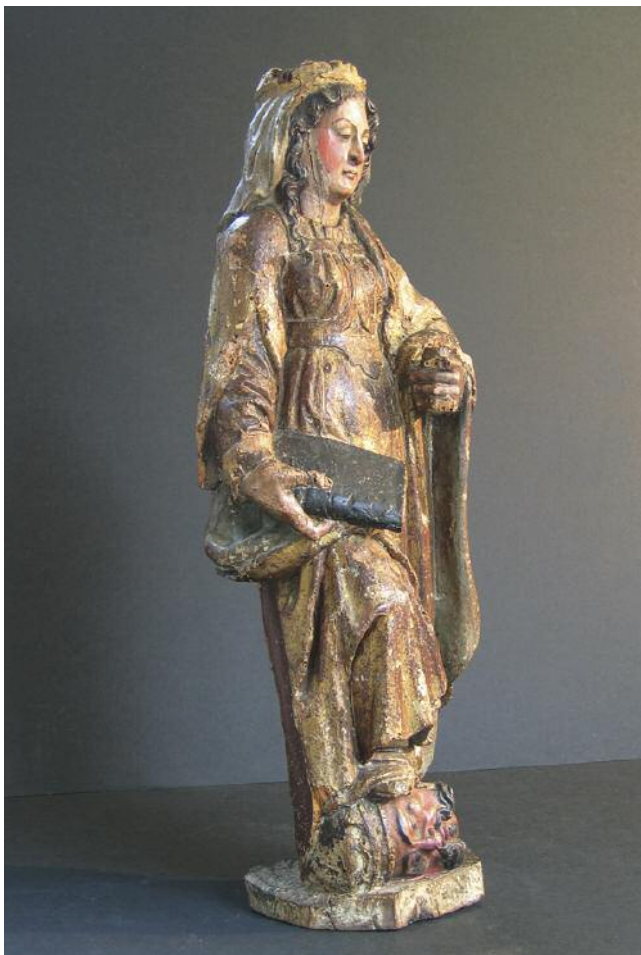
A IMAXE ANTES DA RESTAURACIÓN