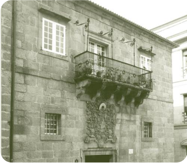
FACHADA DO EDIFICIO Á PRAZA MAIOR