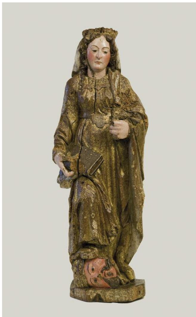
SANTA CATARINA DE ALEXANDRÍA