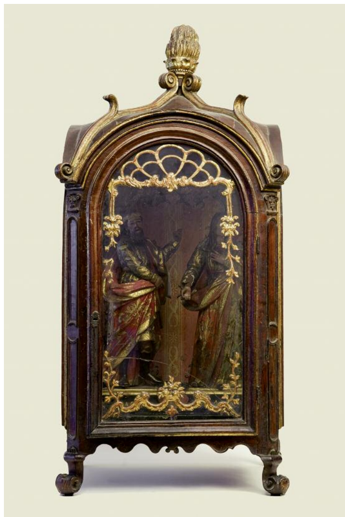
“ESCAPARATE” COAS IMAXES DE SAN XOAQUÍN E SANTA ANA