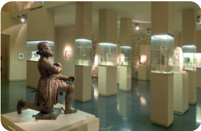
ESCOLMA DE ESCULTURA, SALA SAN FRANCISCO