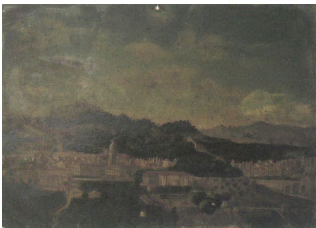
ANVERSO ANTES DA RESTAURACIÓN