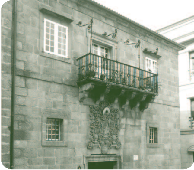
FACHADA DO EDIFICIO Á PRAZA MAIOR