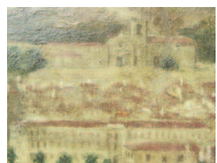
DETALLE DESPOIS DA RESTAURACIÓN

O seguinte paso foi a eliminación do verniz oxidado e da sucidade acumulada sobre a pintura no anverso, empregando unha mestura de xileno e etanol ao 50%, aplicado mediante hisopos de algodón e axuda mecánica moi puntual de agulla. A medida que se vai facendo esta limpeza, tamén se removen algúns repintes con esta mesma mestura. Pero nesta obra, atopamos outros repintes máis persistentes de cor azul que se eliminan cunha mestura de tolueno e dimetilformamida ao 10%.