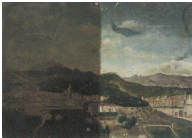
PROCESO DE ELIMINACIÓN DO VERNIZ OXIDADO E DA SUCIDADE

Esa situación obrigounos a realizar toda unha serie de operacións, que describimos seguidamente e que permitiron descubrir os múltiples matices e detalles dunha composición que amosa unha vista de Ourense dende o Salto do Can.