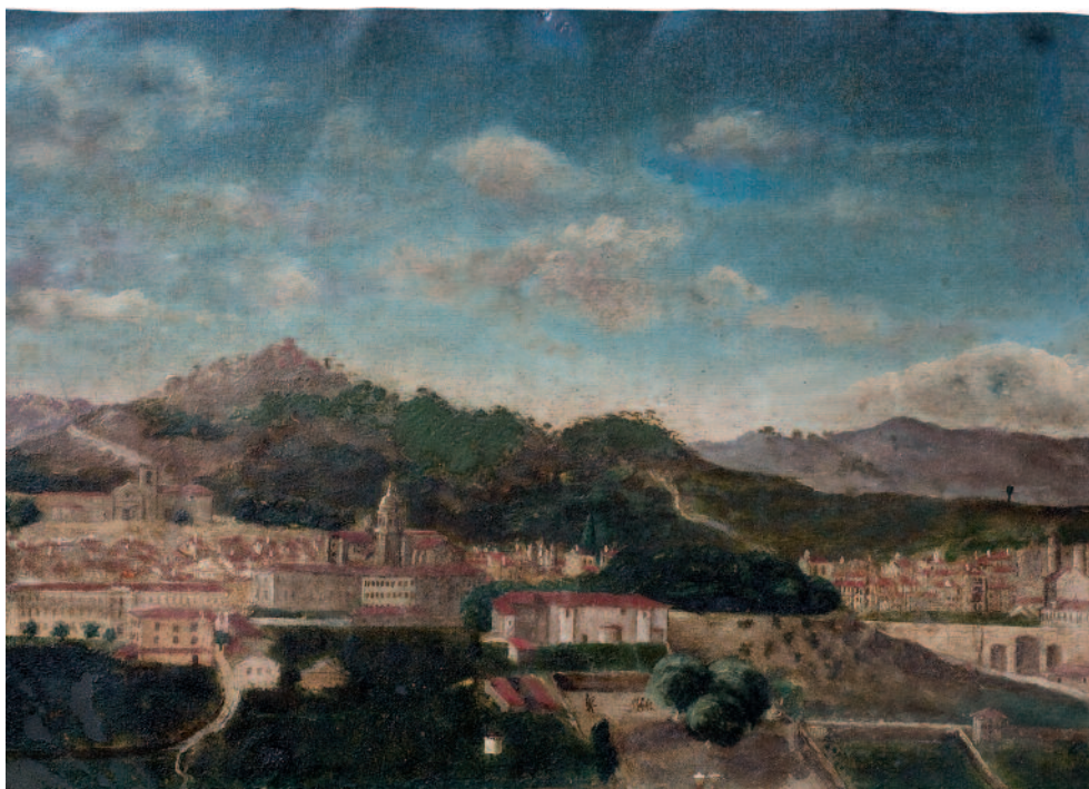
VISTA XERAL DE OURENSE