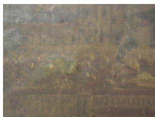
DETALLE ANTES DA RESTAURACIÓN