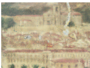
DETALLE DURANTE O TRATAMENTO