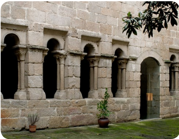
CLAUSTRO DO PATIO DO MUSEO ARQUEOLÓXICO NA SÚA SEDE DA PRAZA MAIOR