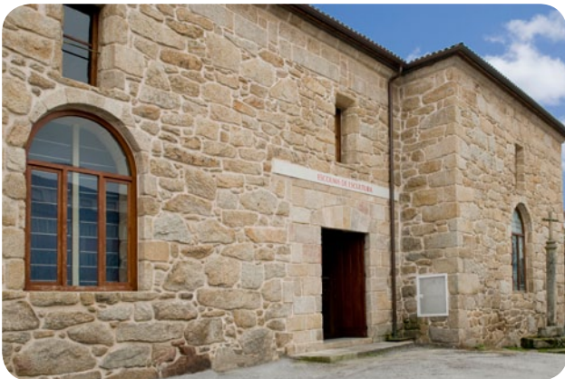
ENTRADA Á SALA DE ESCULTURA DO MUSEO ARQUEOLÓXICO PROVINCIAL SITUADA AO LADO DO CLAUSTRO DE SAN FRANCISCO