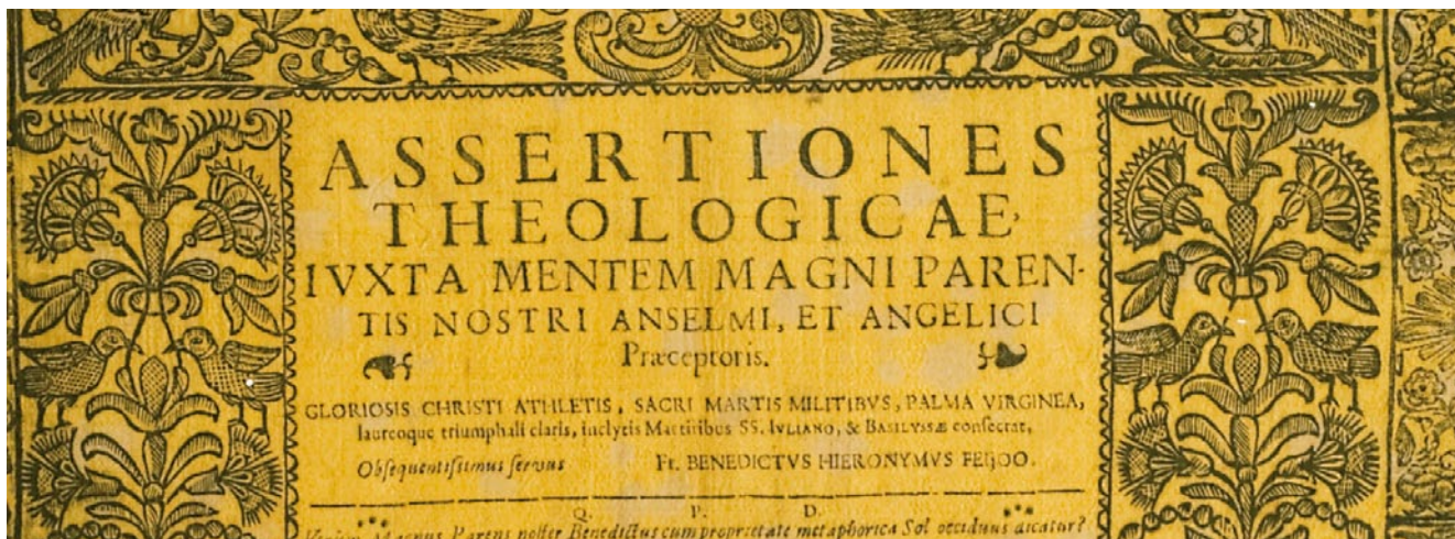
DETALLE DA FOLLA DE GRAO DO PADRE FEIJOO