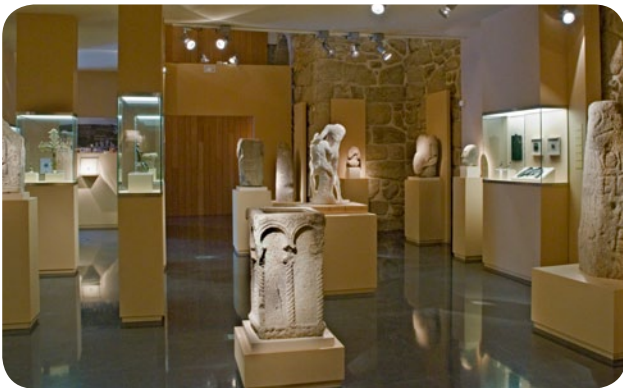
INTERIOR DA SALA DE ESCULTURA DO MUSEO ARQUEOLÓXICO PROVINCIAL