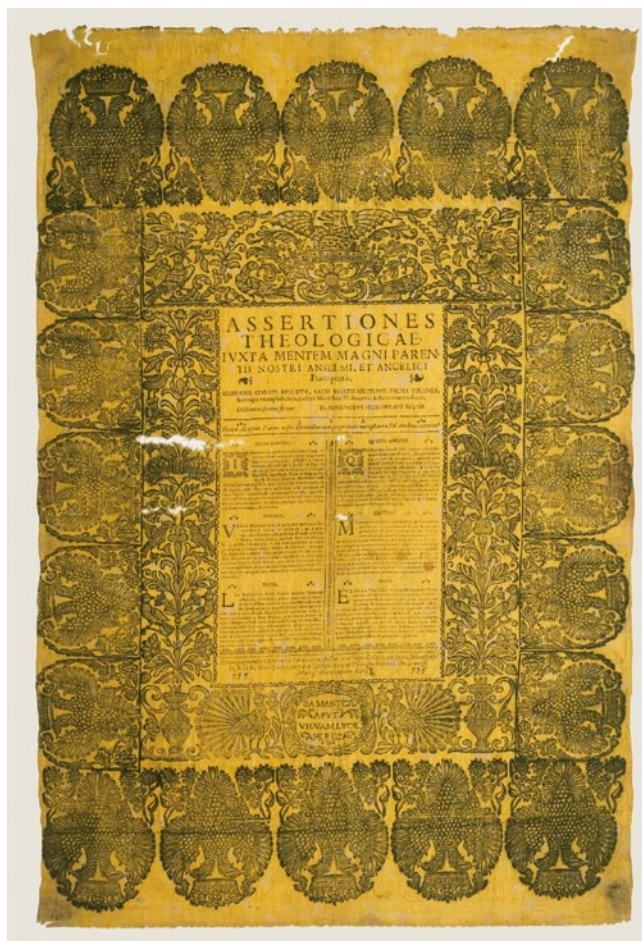
A FOLLA DE GRAO DO PADRE FEIJOO