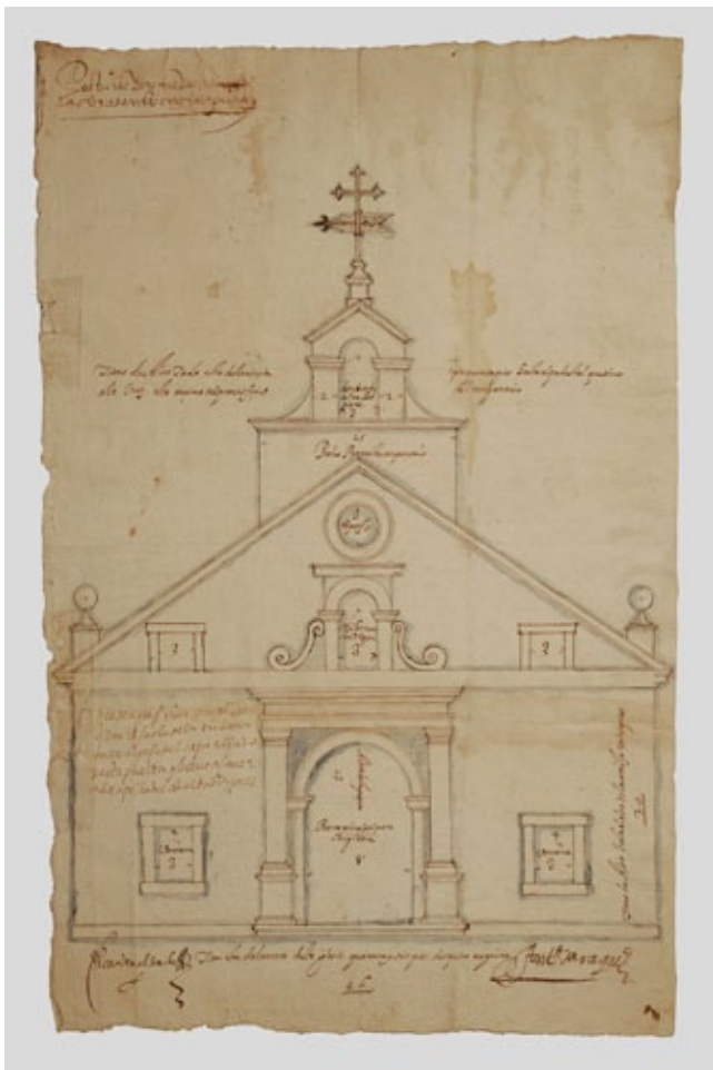
TRAZA POR MARTÍNEZ DE ARAQUE PARA A REEDIFICACIÓN DA ERMIDA (AHPOU)