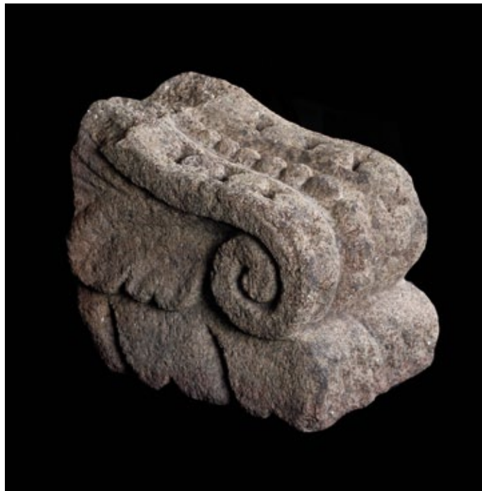
ELEMENTO ARQUITECTÓNICO DA ERMIDA DA NOSA SEÑORA DO POSÍO