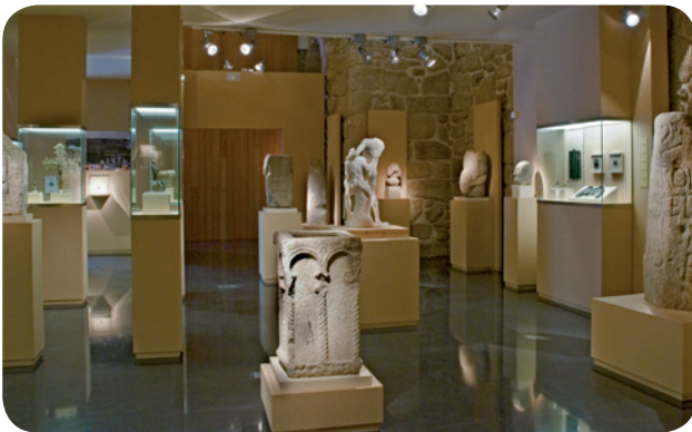
INTERIOR DA SALA DE ESCULTURA DO MUSEO ARQUEOLÓXICO PROVINCIAL