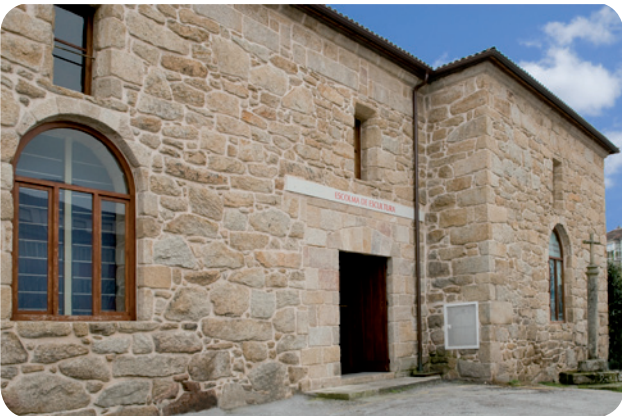
ENTRADA Á SALA DE ESCULTURA DO MUSEO ARQUEOLÓXICO PROVINCIAL SITUADA AO LADO DO CLAUSTRO DE SAN FRANCISCO