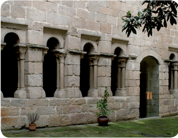
CLAUSTRO DO PATIO DO MUSEO ARQUEOLÓXICO NA SÚA SEDE DA PRAZA MAIOR