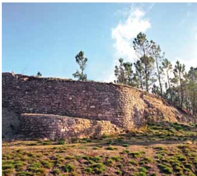
MURALLA. CASTRO COTO DO MOSTEIRO

novas, cunha gran variedade de técnicas e motivos. As vasillas están representadas por olas de pequeno, mediano e gran tamaño, destinadas ao uso doméstico, predominando as formas globulares e as de perfil en «s», cos bordos en aresta e exvasados característicos do interior. Xunto á decoración incisa e impresa, destaca a introdución da estampada con diversas matrices para realizar distintos motivos, predominando os curvilíneos, circulares ou en ángulo. Os curvilíneos están representados con eses simples, dobres, de tres ou catro trazos formando frisos, ou eses compostos que orixinan singulares motivos figurativos como os ornitomorfos ou parrulos. Os círculos poden ser sinxelos, concéntricos ou semicírculos formando composicións de arcadas ou de grilandas. E os triángulos represéntanse recheos de liñas ou lisos, combinados con varios círculos dispostos en liña ou nos vértices a modo de medallóns. Os motivos decorativos dispóñense, na súa maioría en franxas horizontais, delimitados por liñas incisas ou acanaladuras, e sitúanse nas ombreiras, ao longo da barriga, chegando ata a base e tamén no bordo e colo –Castromao, Mosteiro–. Neste momento dáse a presenza das distintas áreas das olarías definidas polas súas facturas, formas e estilos decorativos, orixinando novas tipoloxías –Cameixa, Castromao, A Forca, Mosteiro–, e marcando as diferenzas rexionais ou locais na cunca do Miño e nas Rías Baixas, como noutras manifestacións da cultura castrexa.