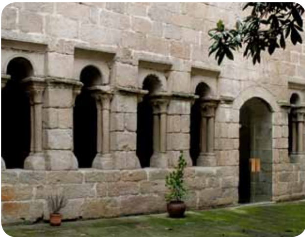
CLAUSTRO DO PATIO DO MUSEO ARQUEOLÓXICO NA SÚA SEDE DA PRAZA MAIOR