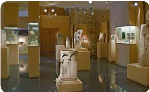
INTERIOR DA SALA DE ESCULTURA DO MUSEO ARQUEOLÓXICO PROVINCIAL