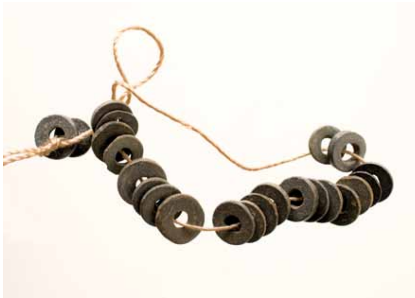
O COLAR DE DOAS DISCOIDES DA MÁMOA M2 DE SAN BIEITO (LOBIOS, OURENSE)