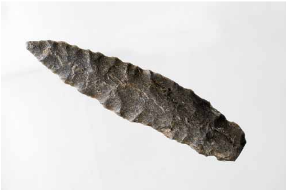
PUNTA SOLUTRENSE DE CASARDOMATO