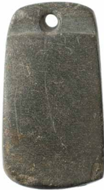
PEDRA DE TOQUE CASTRO DE SAN CIBRAO DE LAS