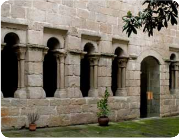
CLAUSTRO DO PATIO DO MUSEO ARQUEOLÓXICO NA SÚA SEDE DA PRAZA MAIOR