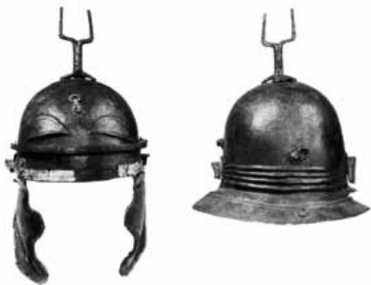
CASCO PROCEDENTE DO CAMPAMENTO LEXIONARIO DE WINDISCH (VINDONISSA MUSEUM, BRUGG).