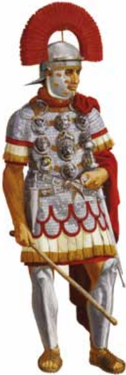
CENTURIÓN. DEBUXO DE PETER CONNOLLY (RÖMISCH-GERMANISCHES ZENTRALMUSEUM, MAINZ)

podemos citar armas de empuñadura, como a espada curta ( gladius ) ou longa ( spatha ) o puñal ( pugio ), e armas de hasta como o pilum ou as lanzas ( hasta , lancea ). Entre as segundas inclúense, por un lado, as armas pasivas como o casco ( cassis ), a coiraza ( lorica ) e as grebas ( ocreae ) e, por outro, as activas, en concreto o escudo ( scutum ). A pesar de que podemos falar dunha panoplia tipo entre as lexións e as tropas auxiliares de Roma, non existía un concepto de uniformidade semellante ao dos corpos militares actuais e, se analizamos polo miúdo as armas e o contexto onde foron atopadas, apreciamos unha notable variedade. Deste xeito, a uniformidade de equipamento en sentido romano significa que cada soldado levaba un casco, unha coiraza, unha daga, unha espada, un escudo e dúas lanzas, así como unha vestimenta básica consistente nunha túnica, un cinto, unha capa e unhas botas.