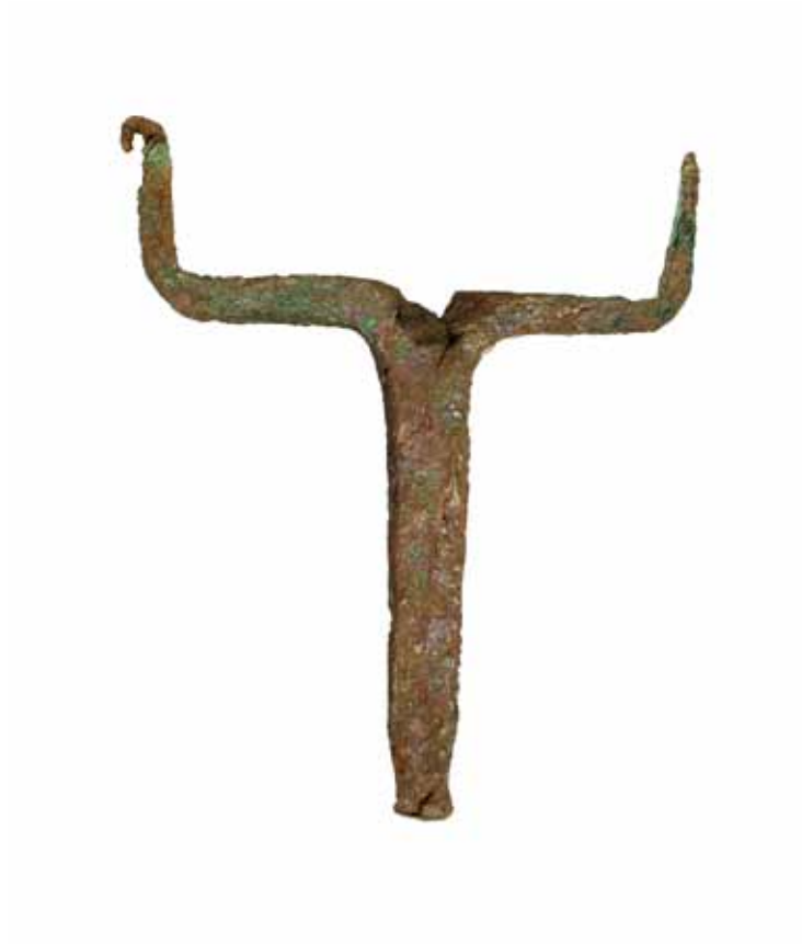
PORTAPENACHO DE CASCO CAMPAMENTO AQUAE QUERQUENNAE