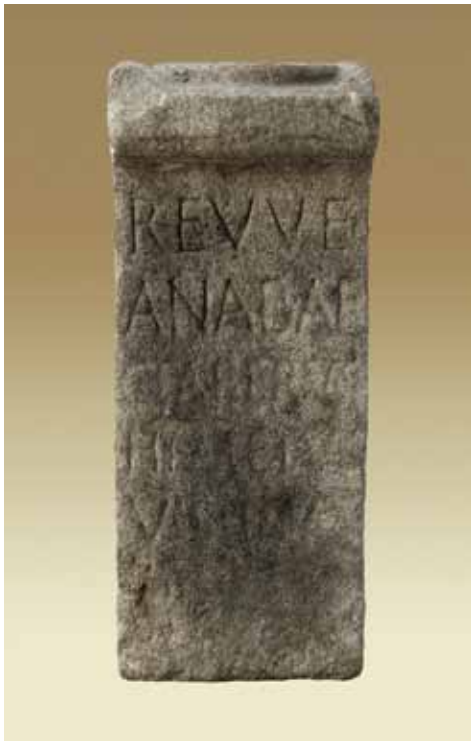
ARA A REVE