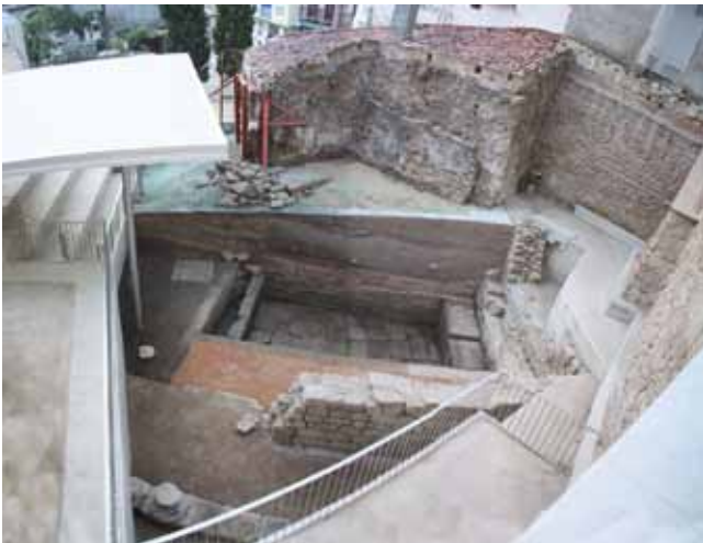
CASA DOS FORNOS