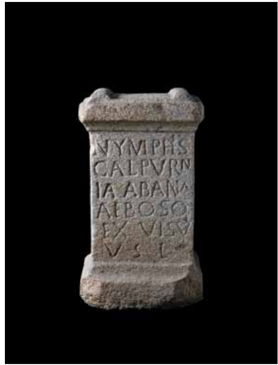
ARA ÁS NINFAS DE CALPURNIA ABANA

curación baixo a inspiración dun soño. Este ritual, denominado incubatio , ten unha orixe moi antiga. Consiste en peregrinar a un santuario ou sitio sagrado e durmir alí. A divindade, neste caso as Ninfas, revelaranlle á doente, nun soño, as causas do mal e a forma de curarse por medio das augas minero-medicinais, concedéndolle a estas augas un poder curativo milagroso.