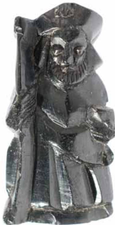
SANTIAGO PEREGRINO DE ACIBECHÉ AS BURGAS, OURENSE