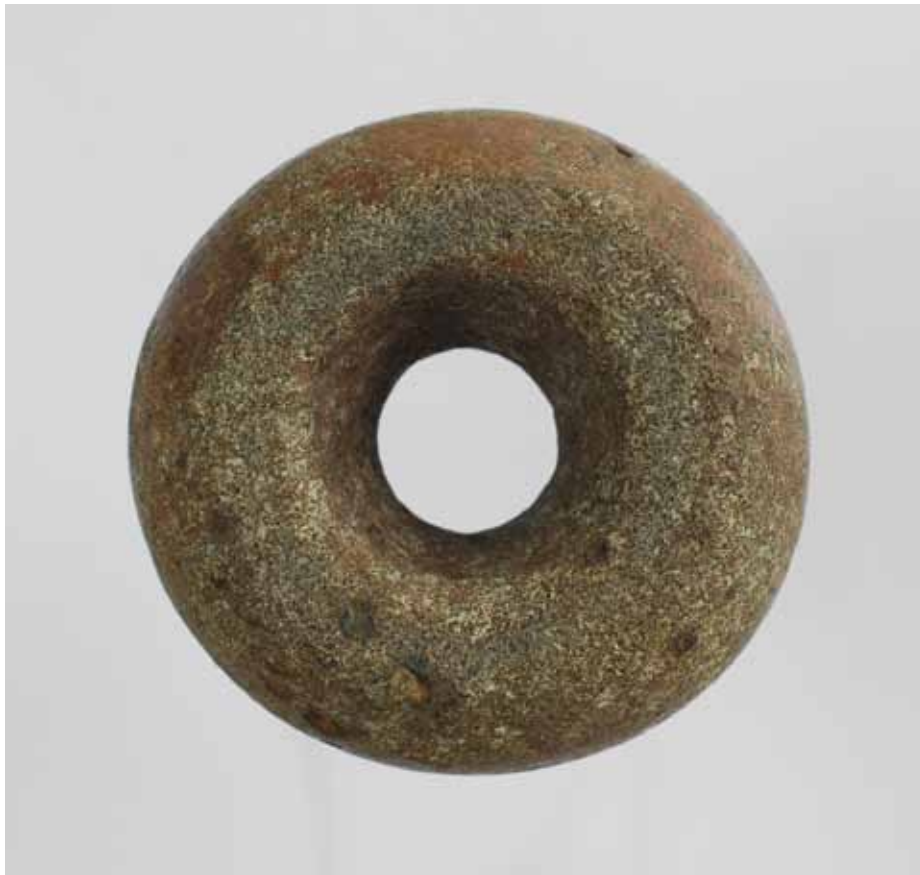
O ESFEROIDE PERFORADO DO VALIÑO (CARTELLE, OURENSE)