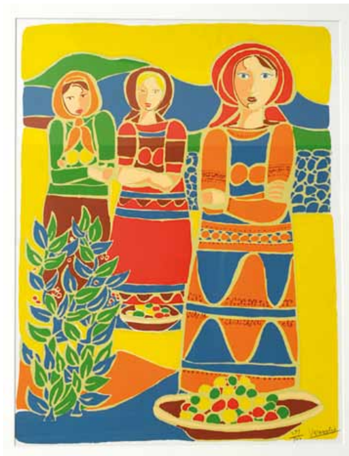
COLECCIÓN SEGA (SERIGRAFÍAS DE ARTE)