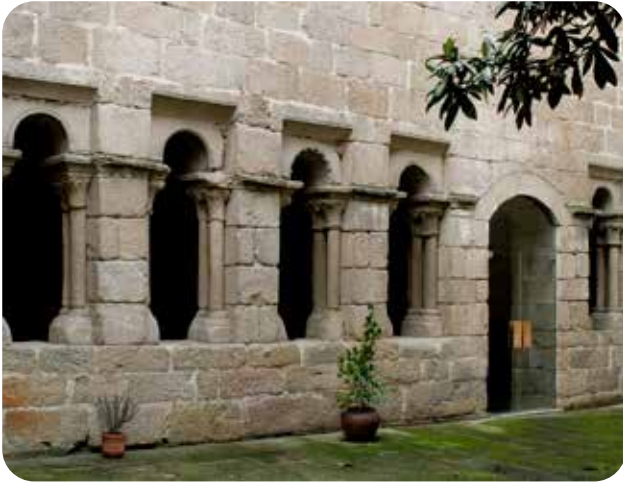
CLAUSTRO DO PATIO DO MUSEO ARQUEOLÓXICO NA SÚA SEDE DA PRAZA MAIOR