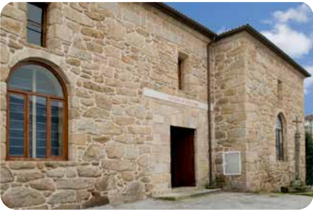
ENTRADA Á SALA DE ESCULTURA DO MUSEO ARQUEOLÓXICO PROVINCIAL SITUADA AO LADO DO CLAUSTRO DE SAN FRANCISCO