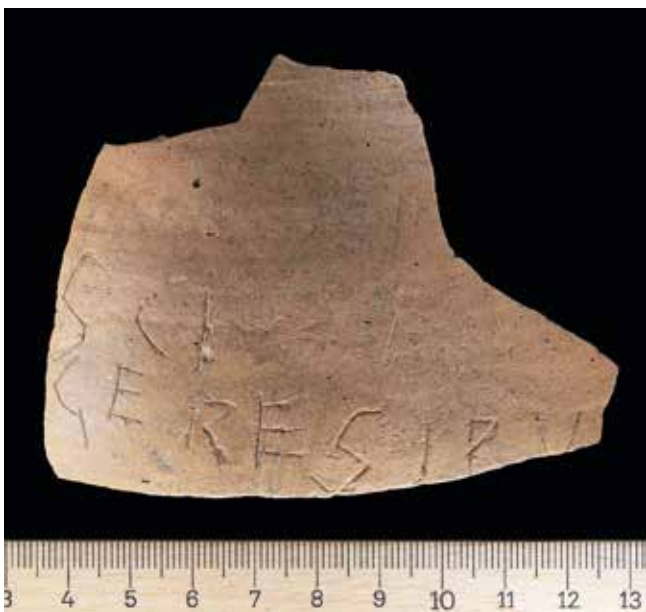
FRAGMENTO CERÁMICO CON GRAVADO DOS BAÑOS DE RÍO CALDO.