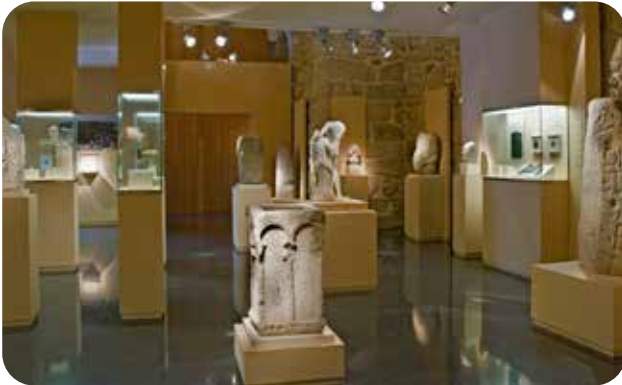
INTERIOR DA SALA DE ESCULTURA DO MUSEO ARQUEOLÓXICO PROVINCIAL