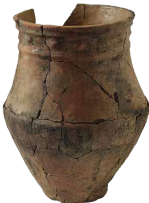
URNA DE CAMEIXA