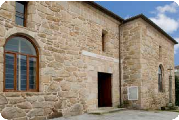
ENTRADA Á SALA DE ESCULTURA DO MUSEO ARQUEOLÓXICO PROVINCIAL SITUADA AO LADO DO CLAUSTRO DE SAN FRANCISCO