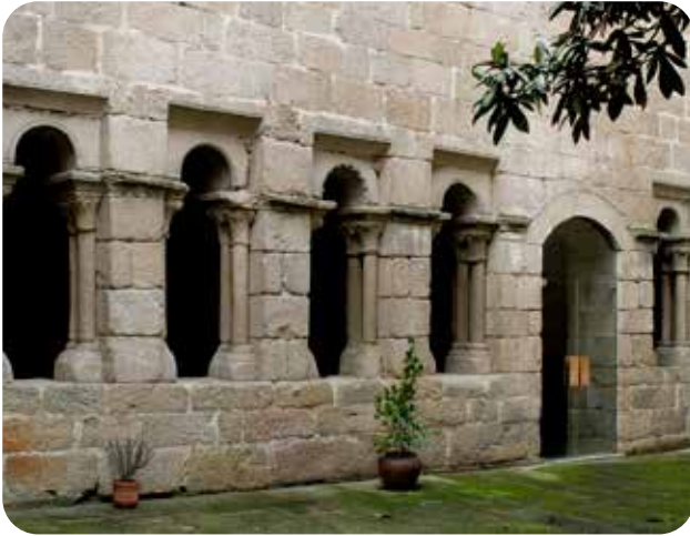
CLAUSTRO DO PATIO DO MUSEO ARQUEOLÓXICO NA SÚA SEDE DA PRAZA MAIOR