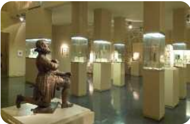
ESCOLMA DE ESCULTURA, SALA SAN FRANCISCO