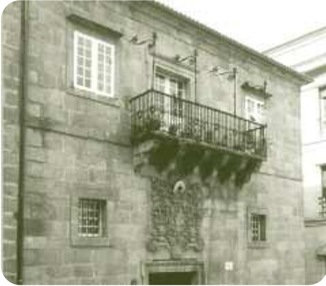
FACHADA DO EDIFICIO Á PRAZA MAIOR