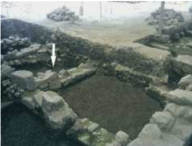
ZONA DE APARICIÓN NA IGREXA VELLA