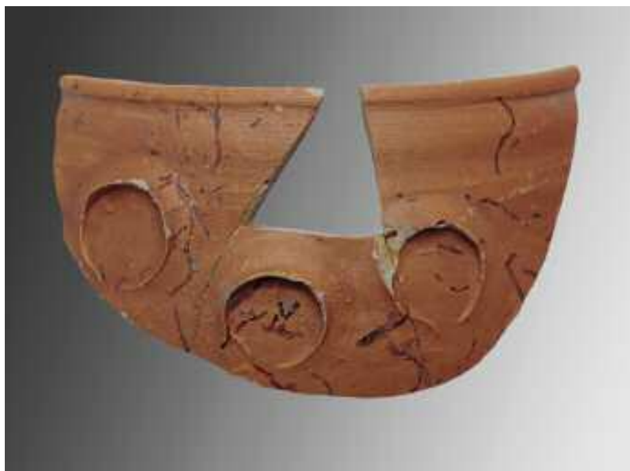
CUNCA “DE IMITACIÓN” DE PAREDES FINAS EMERITENSES